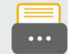
MANEJO DE IMPRESORAS FISCALES