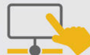
PUNTO DE VENTA 100% TOUCH-SCREEN